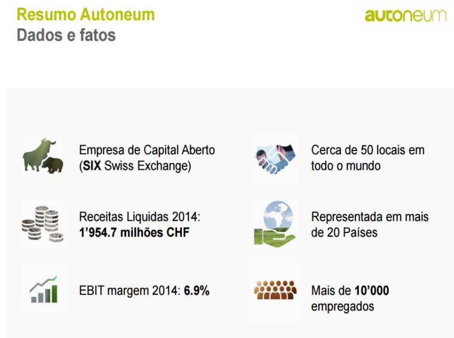
Figura 1 – Resumo Autoneum

A Autoneum é líder em tecnologia e com amplo portfólio de produtos focados em acústica, isolamento térmico e acabamento. Otimização interna de desenvolvimento de ferramentas de simulação e um sistema de medição com padrão de indústria.