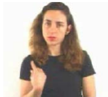
“Nada sobre Nós sem Nós”. (Movimento das Pessoas com Deficiência - anos 70)

A abertura política no Brasil, observada a partir do final da década de 70, foi marcada por Movimentos Sociais, incluindo os Movimentos das Pessoas com Deficiências e também das que se encontravam em condição de marginalidade ou discriminadas por sua orientação sexual, gênero e etnia, entre outros.