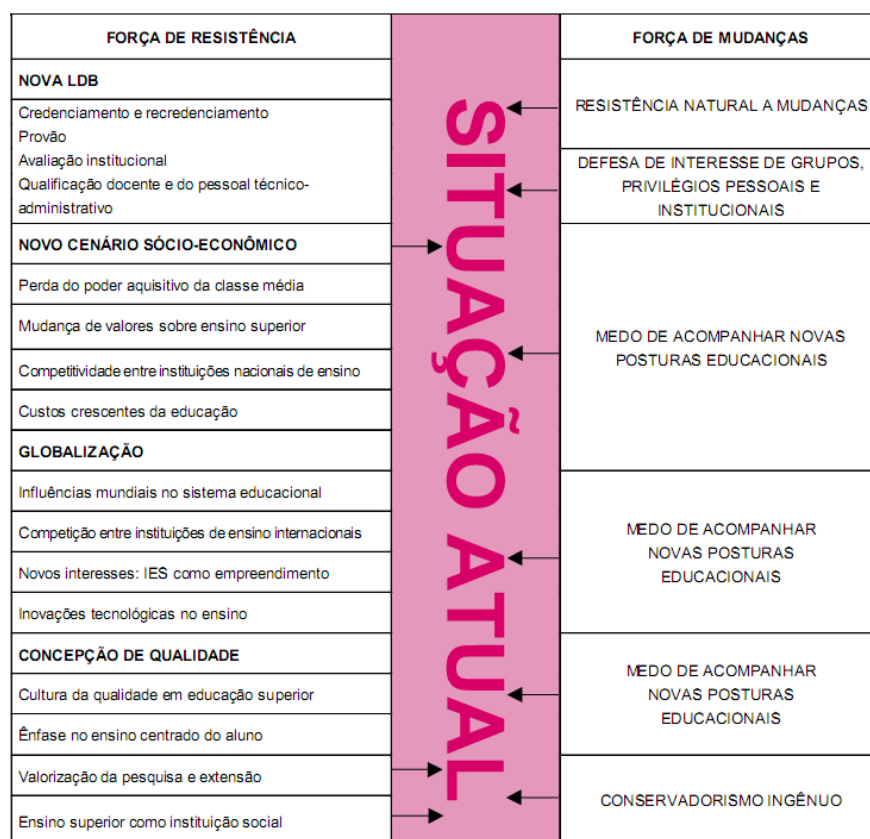
Figura 1 - Força de mudanças no ambiente da educação superior no Brasil

Mesmo diante das acertadas inserções da LDB em relação ao ensino superior, deve-se analisar as inúmeras contradições que permeiam as universidades brasileiras no contexto atual, algumas decorrentes das forças de resistência encontradas neste âmbito, conforme apontam com bastante propriedade Colossi et al (2001), na figura a seguir.