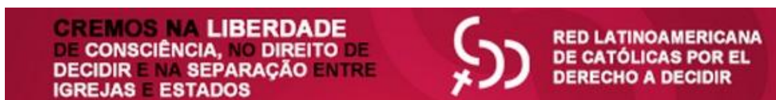
Figura 2 - Modelo de banner da campanha da CDD