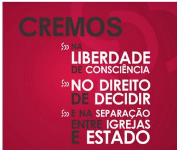
Figura 1 - Modelo de banner da Campanha da CDD