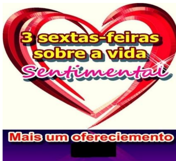
Foto 15 48 Flyer de Divulgação da Programação ADFEC

As músicas que eram melancólicas e sensibilizava os membros com letras que verbalizavam a respeito da solidão, vitória e triunfo. Os moradores que chegavam em estado crítico ou situações limites, eram amparados pelos membros. Haja vista serem moradores do mesmo espaço. Alguns, cultos eram específicos, e tratavam de temas diversos. A imagem abaixo, traz um apelo via rede social que convida os moradores a ouvirem pregações acerca de suas vidas sentimentais.