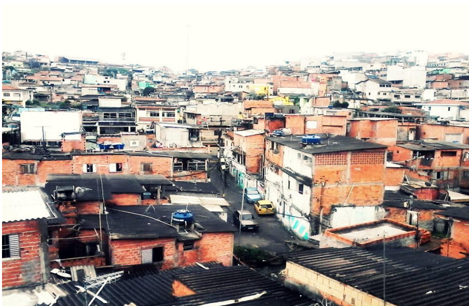
Foto 2. Centro da Favela do São Jorge

Quando entrei em contato com a Subprefeitura de Cidade Ademar 11 , para aferimentos de dados, tive dificuldades, não poucas, pois a favela não é cadastrada na Subprefeitura. Portanto, as informações que forneceram são baseadas nas aproximações de números de moradores que residem atualmente no local. Pode-se verificar as informações no anexo 12 , que a favela possui um número aproximado de 500 famílias de 3 a 4 moradores por casa.