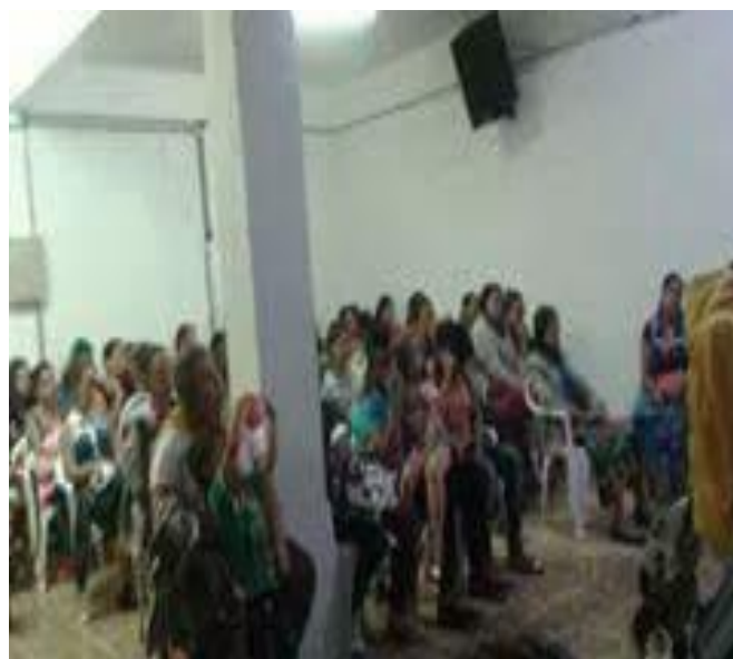
Foto 13 45 Culto na ADFEC