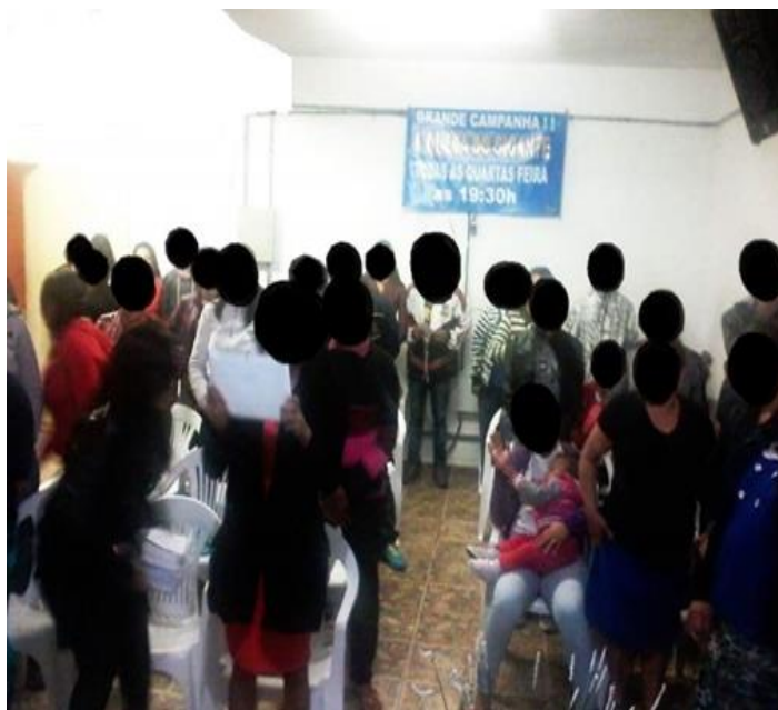
Foto 14. Culto na ADFEC 47