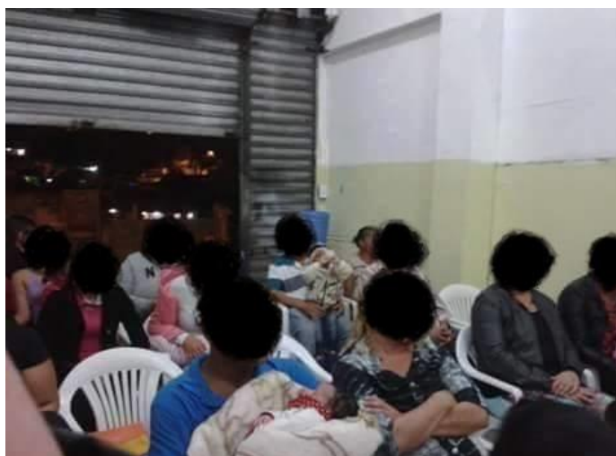
Foto 16 50 Igreja Ministério Palavra e Vida