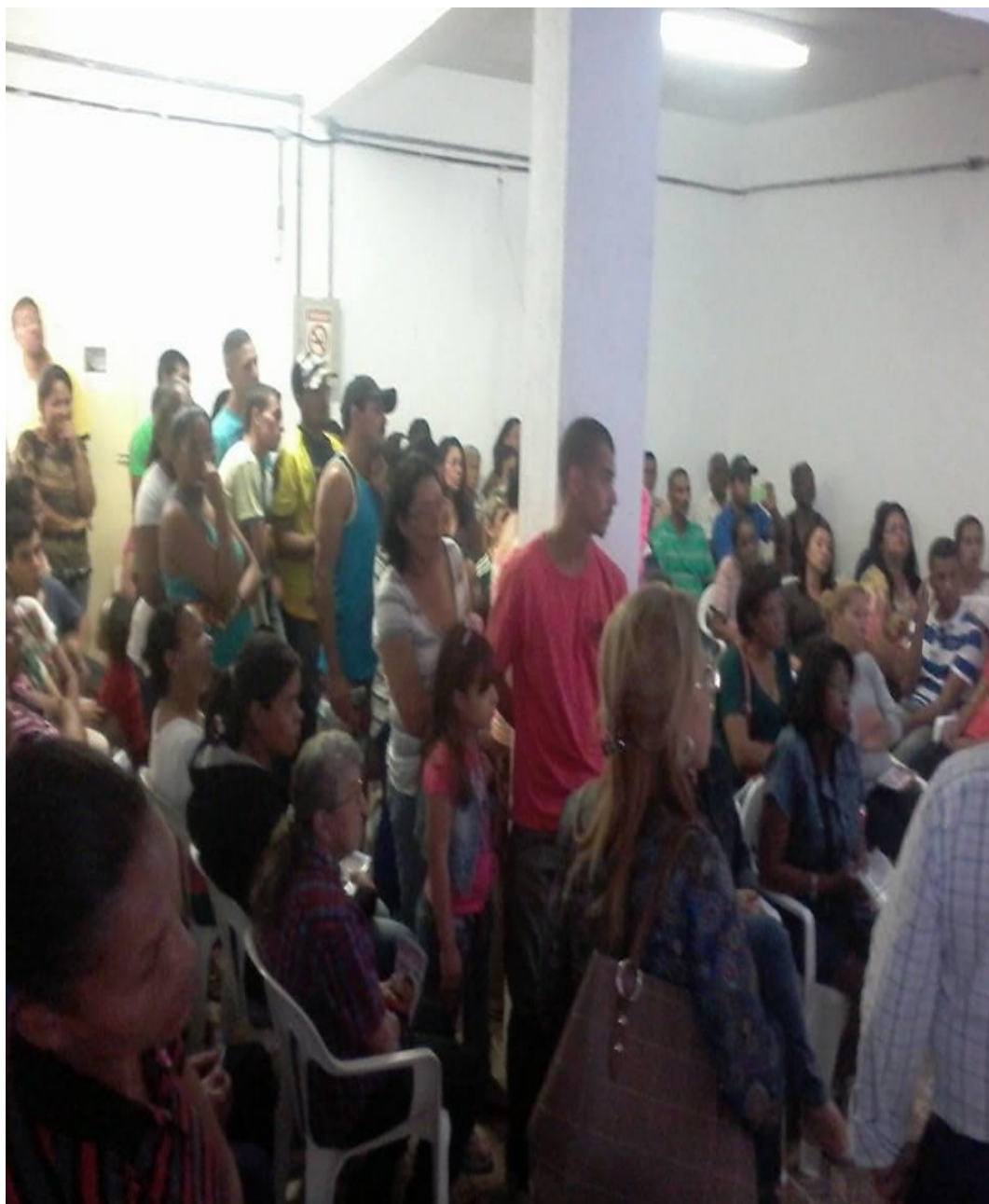
Foto 6. Culto na ADFEC 38