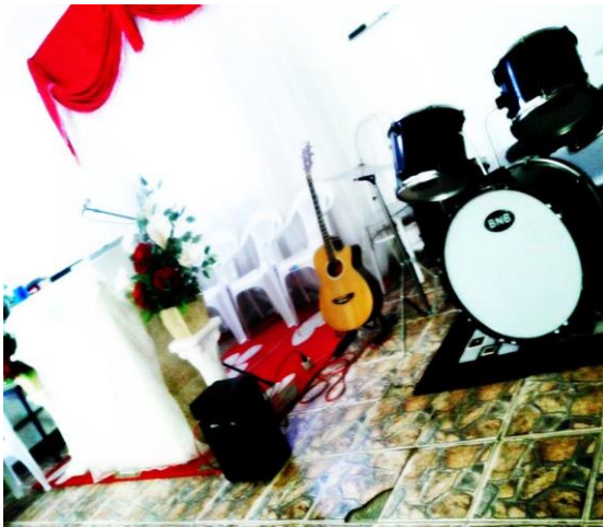
Foto 12 44 Caixas de Som