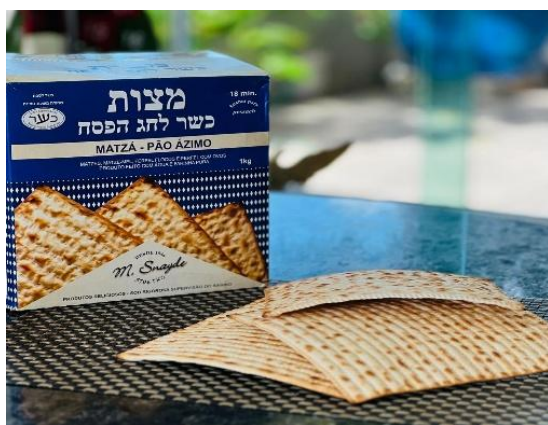
Fig. 135 - Pão Ázimo

Durante a Páscoa judaica, aos que seguem a religião, não comem pão e derivados que tenham sido fermentados, utiliza-se a farinha de Matzá e a fécula de batata. Outros grãos são proibidos, como trigo, cevada, centeio, aveia e espelta.