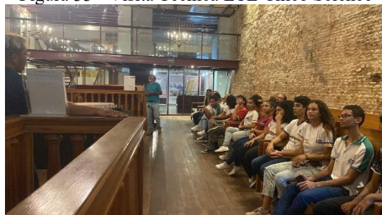
Figura 33 - Visita Técnica ETE Chico Science