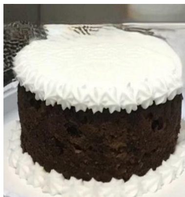
Figura 53 - Bolo de Noiva (frutas)