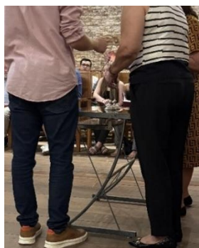
Fig. 126 – Acendimento das velas

E as luzes, simbolizam alegria e serenidade que marcam o Shabat . Wiener e Yifrach (2018, p. 08) descreve que o acendimento das velas do Shabat , segue os preceitos da Torá e que está nas mãos das mulheres – hadlacat henêr acender essas velas, porque, tem a representação da verdadeira beleza e graciosidade da mulher judia.