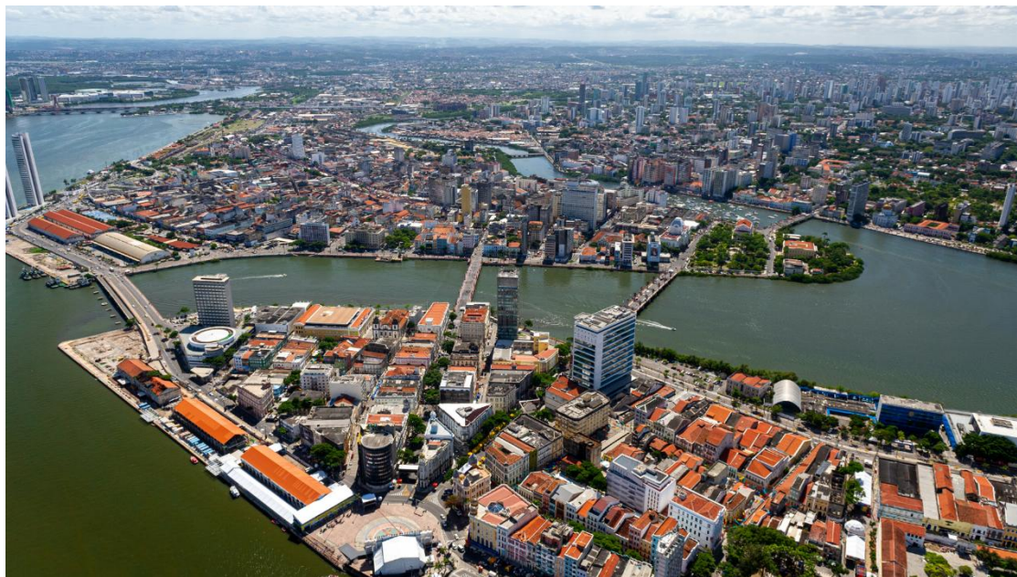
Figura 48 - Vista Panorâmica do Recife-PE

A Capital do estado de Pernambuco, Recife, está localizada na Mesorregião Metropolitana (Microrregião de Recife), sede de maior aglomeração urbana do Norte-Nordeste com uma concentração de destaque para o Polo Médico e o Polo Acadêmico-Educacional. Hoje, a Veneza da América que se difunde sobre o delta formado pelos rios Capibaribe, Beberibe, Jiquiá, Tejipió e Jaboatão.