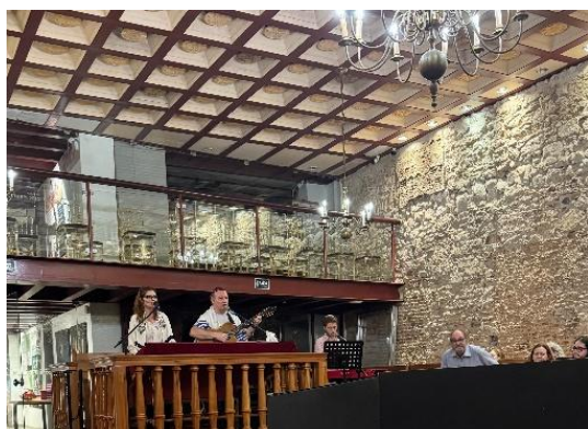
Figura 71 – Serviço religioso na sinagoga