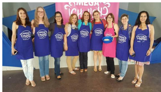
Figura 14 - Mega Challah 2017