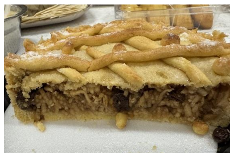
Figura 123 - Torta de Maça

Torta de Maça , uma massa delicada e crocante com recheio de maçãs raladas e canela. A maçã expressa para o judeu doçura, saúde, fertilidade e resistência, mas também Gan Eden – o Paraíso.