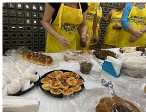
Figura 22 - Mega Challah 2024