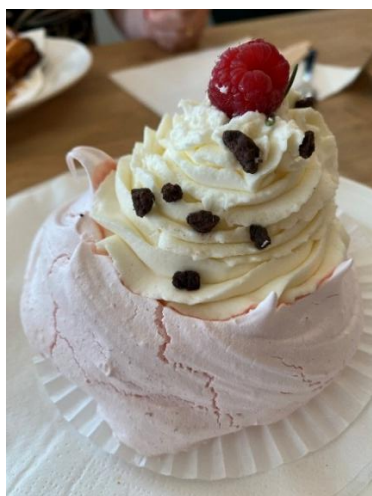
Figura 87 - Tort Bezarose