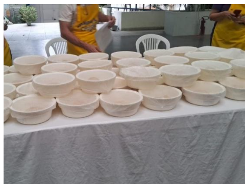
Figura 21 - Mega Challah 2024