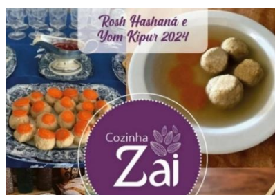
Figura 108 - Guefilte Fish

Guefilte Fish , um preparo a base de peixe que imprime um significado histórico para o povo judeu, ligado à fertilidade, crescimento, multiplicação, abundância e prosperidade. As rodelas de cenouras representam moedas de ouro, fartura.