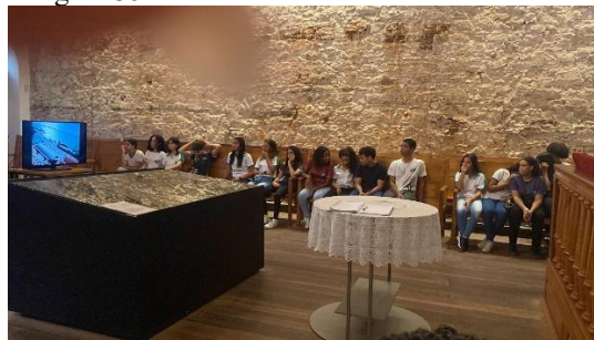
Figura 35 - Visita Técnica ETE Chico Science