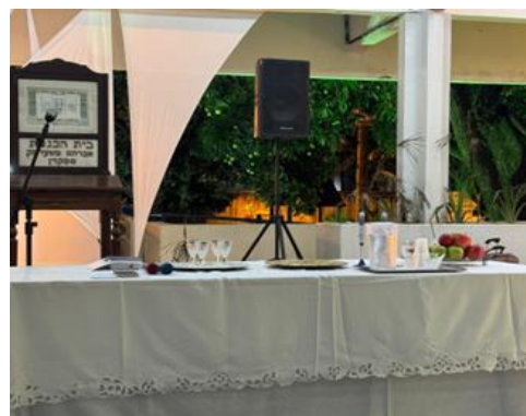
Figura 24 - Rosh Hashaná 02/10/24