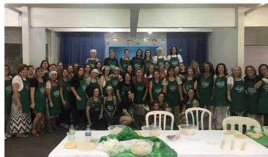
Figura 16 - Mega Challah 2019