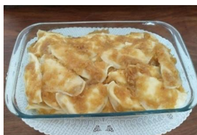
Figura 107 - Vareneques

Vareneques , uma massinha no formato de pastel, recheada com purê de batata e cebola, acompanhada de cebola frita.