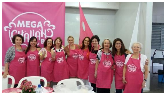
Figura 13 - Mega Challah 2016

Entre outros eventos, se pode destacar a Mega Challah que acontece anualmente na Federação Israelita de Pernambuco - FIPE, em Recife.