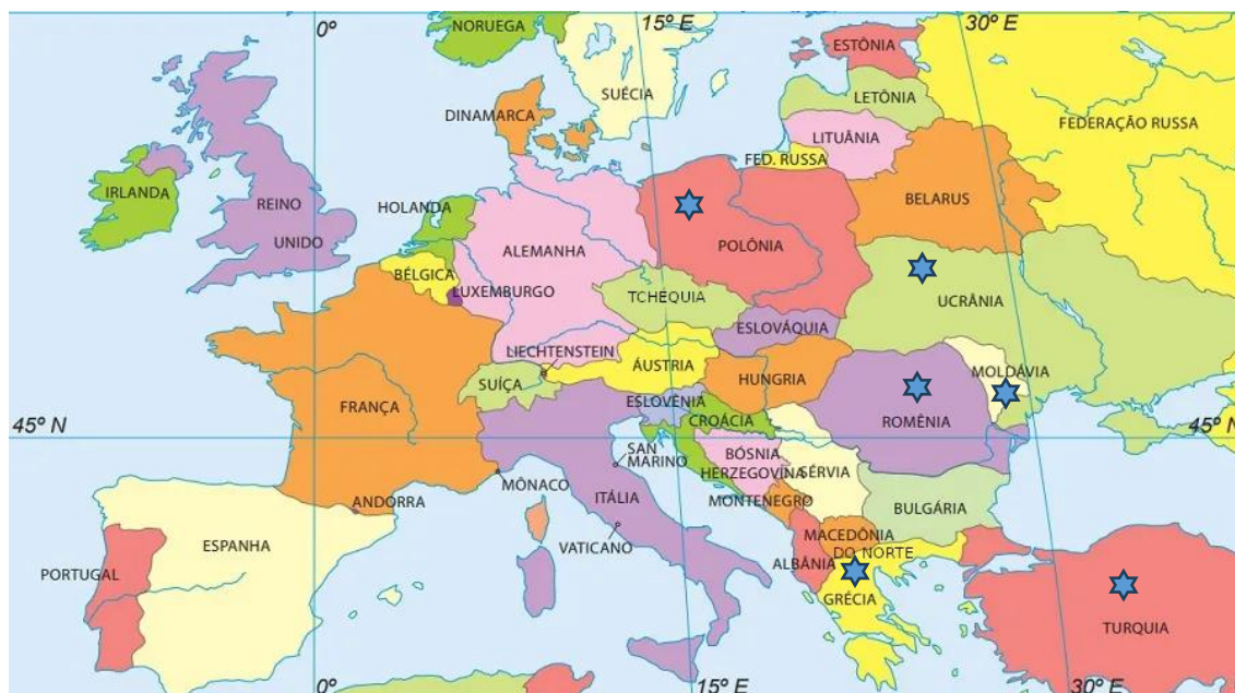
Figura 62 – Mapa do Leste Europeu