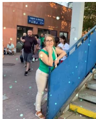
Figura 7 - Wejscie Dworzec de Chelm, Poland