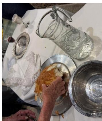
Fig. 129 – A Challah e o Vinho