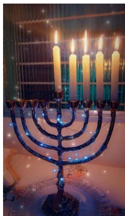
Fig. 132 - Quinto dia