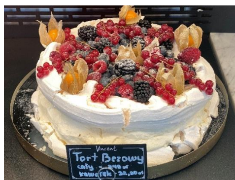
Figura 86 - Tort Bezowy