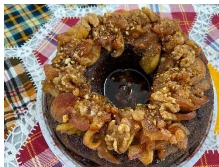
Figura 115 - Bolo de mel, maçã e nozes

Bolo de mel, maçã e nozes: símbolo de Rosh Hashaná , lanche consumido no ano novo judaico