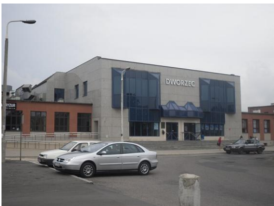
Figura 6 - Wejscie Dworzec de Chelm, Poland