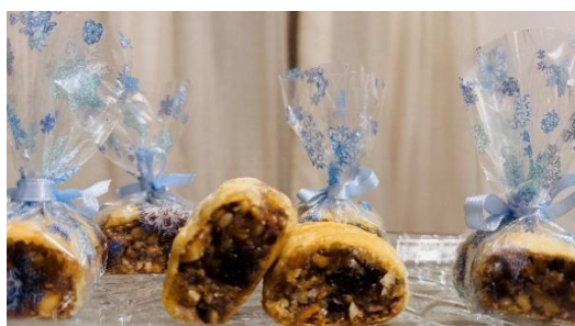
Figura 89 - Fludens