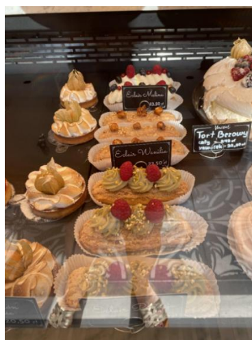
Figura 88 - Eclair Malina – Eclair Wanilia