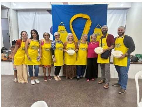
Figura 19 - Mega Challah 2024

Os preparos da chalá era tido como uma tarefa especial das mulheres da família. Separar uma porção, isto é, a chalá , ao preparar o pão que serviria como alimento, é uma das três mitzvot que D'us ordenou às mulheres judias, juntamente com as leis da mikvê e do acender das velas de Shabat . Ao fazer isto, a mulher judia reconhece que o pão, assim como todo tipo de sustento físico, é uma dádiva divina. Ao seguir este mandamento, ela atrairá bênçãos para seu lar e seu ato é comparável à oferenda dos Cohanim na época do Grande Templo, às sextas-feiras (Instituto Morashá de Cultura, 2022).