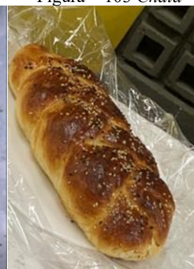
Figura – 103 Chalá

Na abordagem realizada a outra jovem, buscava-se captar suas representações sociais a respeito de seu aprendizado, se realmente instruiu-se a fazer algum prato típico judaico.