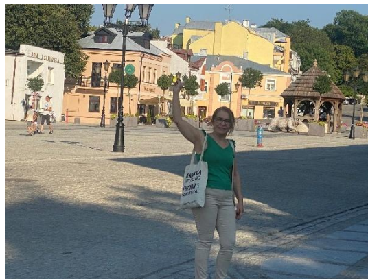
Figura 5 - Praça Łuczkowski – Chelm, Poland