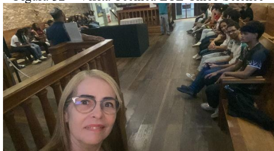
Figura 32 – Visita Técnica ETE Chico Science

Entre os eventos que são realizados no Museu Sinagoga Karl Zur Israel, visita de turistas e visitas técnicas de centros educacionais. A Sinagoga é um espaço aberto ao público em geral, considerado como extraordinário ponto na rota do turístico de Pernambuco, entrou no circuito de templos sagrados do projeto da Prefeitura do Recife por meio da Secretaria de Turismo e Lazer da cidade. Com o ingresso no programa, a prefeitura disponibiliza guias bilíngues qualificados para exibir com riqueza de detalhes a importância histórica, arquitetônica e cultural do prédio e descrever sobre a história da imigração judaica em Pernambuco. O espaço contou com a visita de da Escola Técnica Estadual Chico Science, eu coordenava um grupo de estudantes junto com o professor de história a fim de divulgar sua importância.