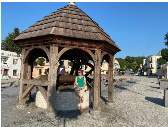
Figura 4 - Praça Łuczkowski Chelm, Poland