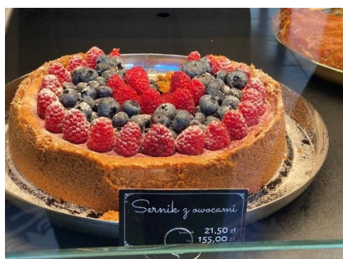
Figura 85 - Sernik z owocami