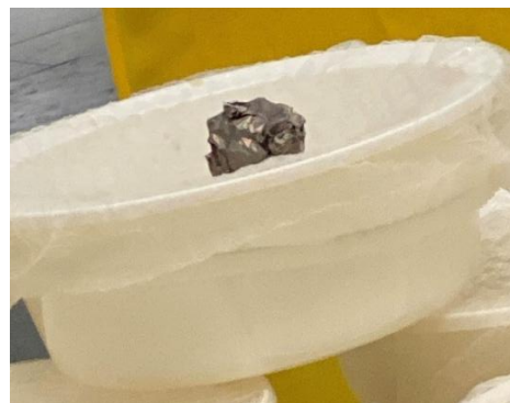
Figura 20 - Mega Challah 2024