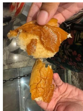
Fig. 130 - Partilha Challah