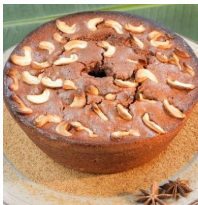
Figura 52 - Bolo Pé de Moleque