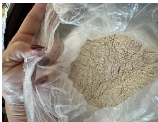
Fig. 136 - Farinha de Matzá