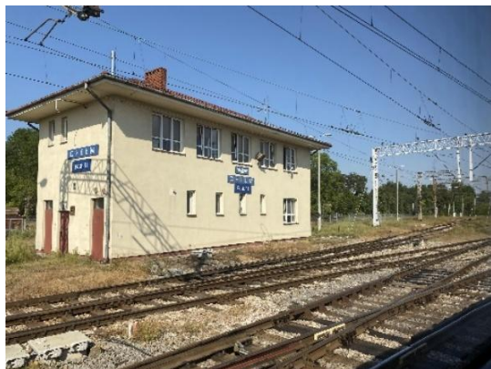
Figura 2 - Estação de Chelm – Poland