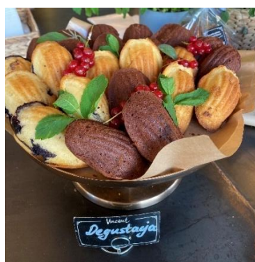
Figura 84 - Degustaya