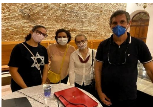
Figura 63 – Curso de Cultura Judaica

Assim, a folkcomunicação tem em sua essência um potencial estratégico para o diálogo com classes “marginalizadas” e não apenas como “objeto de curiosidade, de análise mais ou menos romântica e literária”, mas como categoria de análise de abordagem histórico-crítica de processos de comunicação com foco na cultura de um povo (Melo, 2008, p. 24).