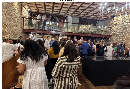
Fig. 66 – Evento realizado na Sinagoga Karal Zur Israel