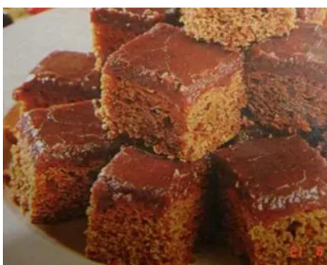
Figura 36 - Bolo de Mel

O bolo de mel é preparado com farinha de trigo, fermento, canela, cravo-da-Índia, noz-moscada, sal, óleo, açúcar mascavo, extrato de baunilha, café coado, suco de laranja, e mel de abelha. E ele é consumido na refeição ritual do ano novo, sendo um prato fundamental para expressar a fé e a comensalidade religiosa. E com todo esse cardápio doce, nós desejamos os nossos melhores votos de “Shana Tová Umetuká” (Raul Lody, 2020, p. 01-02).