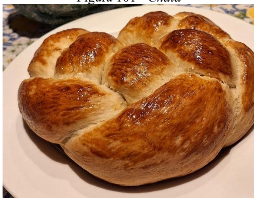
Figura 101 - Chalá

Sobre a Chalá , acredito que de geração a geração, a receita pode sofrer alterações, mas a integridade dela ainda se mantém. O mesmo sobre o molho, pode variar a receita e o modo de preparo com o tempo, porém a receita deve se manter essencialmente íntegra, se não, deixava de ser chamada pelos respectivos nomes (Entrevistada 6).