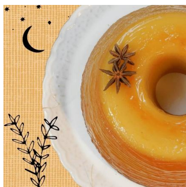
Figura 51 - Bolo Souza Leão