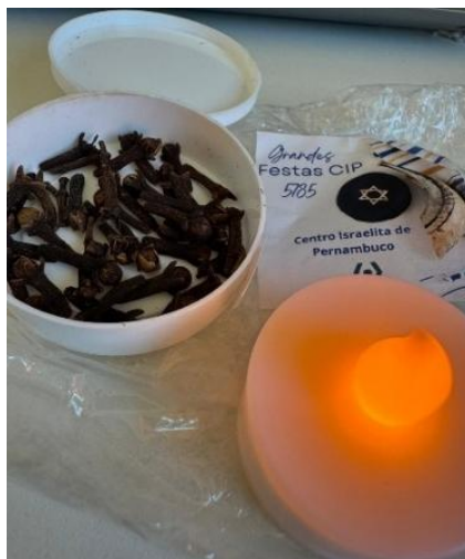
Fig. 127 - Elementos culturais judaicos

cravos-da-índia e uma vela. Simbolicamente, a vela traduz luz e o cravo, uma especiaria que exala cheiro, perfume, atribuído ao poder do revigorar do espírito.