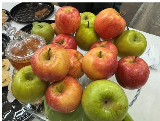
Fig. 138 – Maçãs e Mel