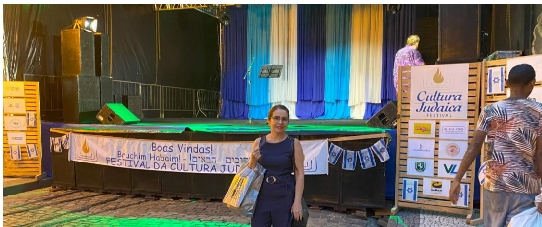
Figura 8 - 30º Festival de Cultura Judaica, Recife - 2022.

Nesse repertório de tradições, se encontra o Festival de Cultura Judaica, evento que costuma ser promovido com atividades vinculadas as tradições da comunidade com a venda de produtos/objetos judaicos, com danças e músicas própria, uma extraordinária gastronomia preparada por seus membros. São festivais que acontecem anualmente em toda rua Bom Jesus que fica localizado em frente a Sinagoga Kahal Zur Israel, na Região Metropolitana do Recife.