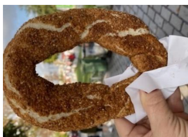
Figura 106 - Beigale

Beigale , um produto feito de massa de pão, em formado de anel, que pode ser recheado com queijo ou batata, fervido e depois assado. Na variação, pode ser coberto com sementes de sésamo ou papoula, ou até mesmo salpicado com sal o canela e açúcar.