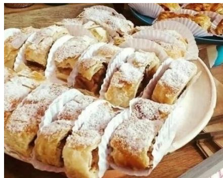
Figura 117 - Strudel judaico

Strudel judaico , um doce típico dos judeus da Alemanha, presente à mesa nas festas de Rosh Hashaná , entre os insumos utilizados em seu preparo, a maçã, o mel, uvas passas, nozes ou castanha do pará e canela.