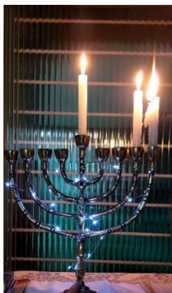
Fig. 131 - Terceiro dia

Nas figuras abaixo pode-se observar o acender de velas no contexto das raízes judaica em lares, o candelabro (menorá), símbolo de sabedoria na Torá ligado a fé, unindo as tradições e a identidade dos povos judeus. As velas são sinônimo de luz e serão acesas uma a uma, a cada dia da semana, consecutivamente. O seu brilho ilumina e expressa melancolia, ilumina o caminho da fé e da esperança. A luz do Shabat lembra os sagrados compromissos que une o povo judeu, acima do tempo e espaço (Algranti, 2002, p.76).