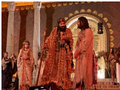
Figura 56 - Cena do julgamento de Jesus