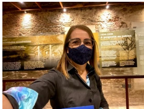
Figura 31 - Curso “Arqueologia da Primeira Sinagoga das Américas, 2022