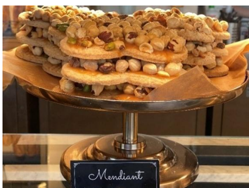
Figura 83 - Mediant

Diante o exposto, pela educação se constrói um mundo melhor, é disso que precisamos. Ao priorizarmos a educação, colocamos o ser humano no centro da ação social. Somente com ela é possível trabalhar por uma sociedade mais íntegra e solidária (Sette, 2005), assim, segue algumas preparações – sobremesas que tive a oportunidade de degustar em viagem a Polônia.