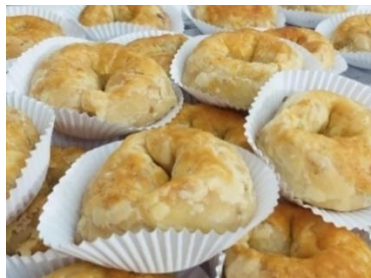
Figura 104 - Beigale de Batata ou Queijo

Beigale de Batata ou Queijo , um salgado delicado feito com massa folhada recheado com batata temperada ou queijo.