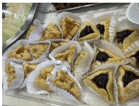
Figura 122 - Oznei Aman

Oznei Aman é um biscoitinho adocicado, recheado com goiabada, uva ou creme de chocolate delicioso.