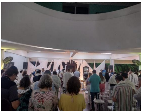
Figura 23 - Rosh Hashaná 02/10/24

Outro evento que traz grande significação para a comunidade judaica é vivenciado por mim, autora da pesquisa, a Rosh Hashaná (Ano Novo Judaico) – Shacharit , promovido pela Federação Israelita de Pernambuco – FIPE, Museu - Sinagoga Kahal Zur Israel. Foi celebrado em 2 (dois) de outubro de 2024 com a presença da primeira rabina brasileira, Kelita Cohen, membro da Confederação Israelita Paulista – CIP.