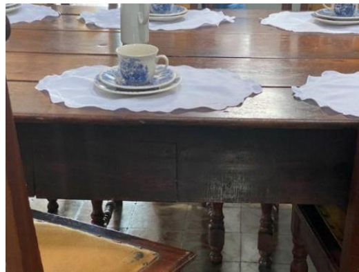
Fig. 140 – Mesa colonial com gaveta Engenho Baixa Verde – Pb.