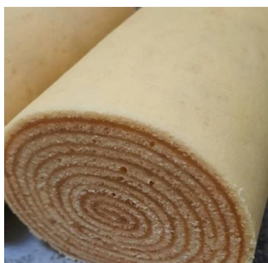
Figura 50 - Bolo de Rolo

Um polo gastronômico multicultural, influenciado pelos povos indígenas, portugueses e africanos que marcaram a história da capital pernambucana desde período da colonização.