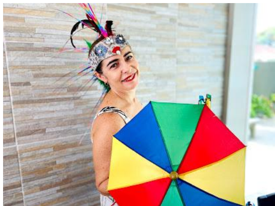
Figura 54 - Sombrinha do Frevo

Segundo Isabel Guillen (2008, p. 161-172), Pernambuco, tanto na área urbana quanto na área rural apresenta uma das culturas mais diversificadas, com suas manifestações folclóricas e culturais marcadas não só pela gastronomia, mais, pela sombrinha do frevo, pelo frevo de rua, de bloco e canção, simbolizada pelo caboclo de lança, pelo maracatu rural, pelas danças do xote, xaxado, baião, banda de pífano, coco de roda, ciranda, quadrilha, pelo cavalo marinho que demarca importante cenário de tradições no contexto em Recife e Região Metropolitana.