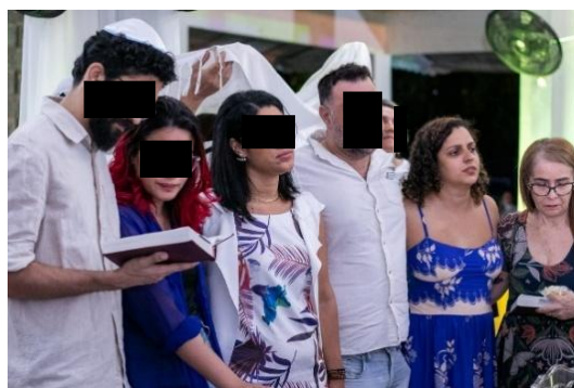
Figura 64 – Rosh Hashaná, 2024 - Fipe