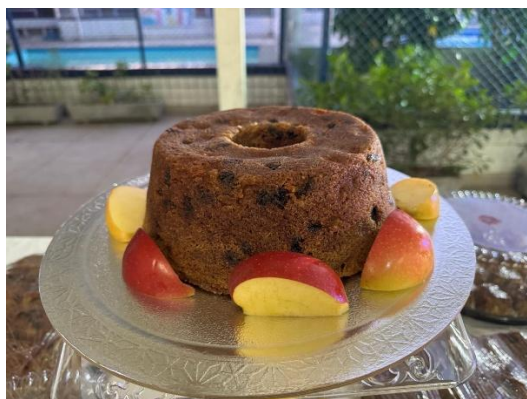
Fig. 137 – Bolo de Maça

Rosh Hashaná , que é a Festa do Ano Novo, onde inclui reuniões nas instituições judaicas e na casa dos familiares, nas quais se comem alimentos especiais, como bolo de mel, legumes e frutas (maçã, romã, tâmara), feijão, alho poró, acelga e cabeça do peixe ou do carneiro.