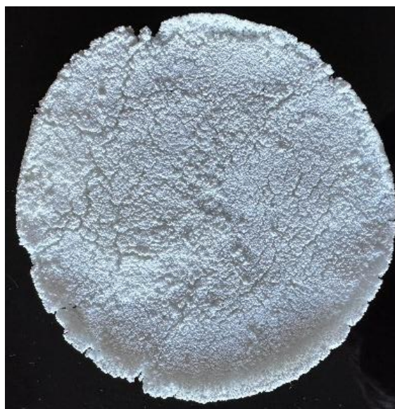
Figura 74 - Beiju - Tapioca