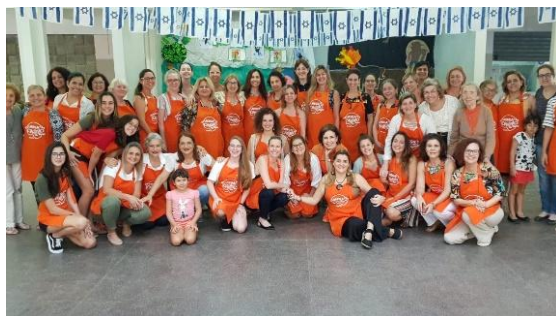
Figura 15 - Mega Challah 2018