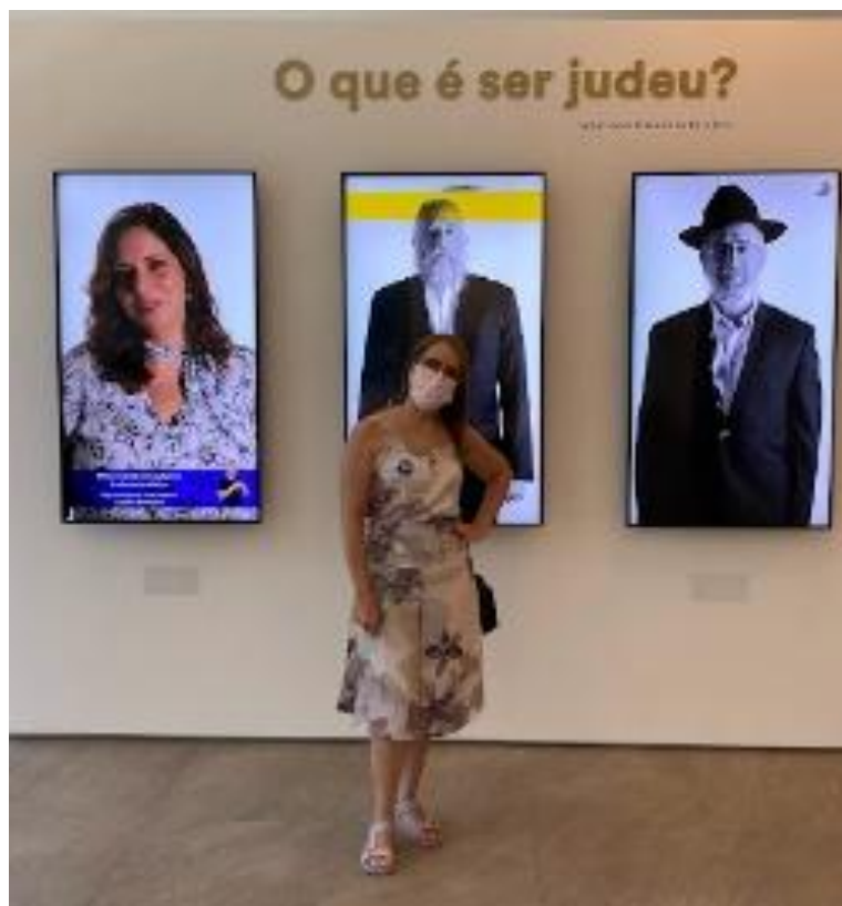
Figura 1 – O que é ser judeu?