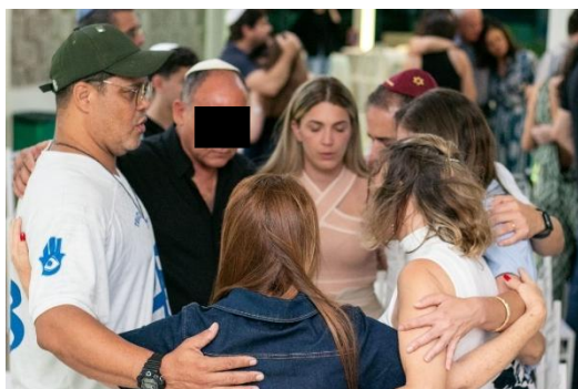
Fig. 65 – Rosh Hashaná, 2024 – Fipe