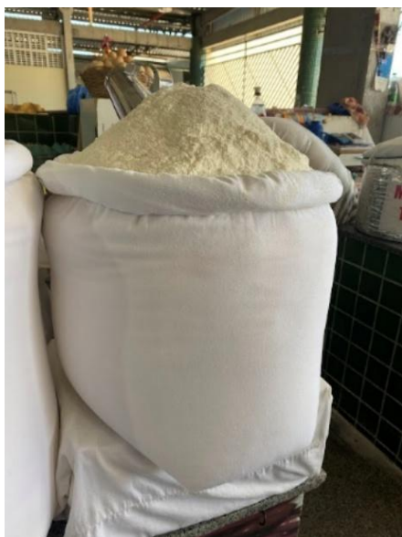
Figura 73 - Massa de mandioca

Afirma ainda a pesquisadora Tania Kaufman (2020, p. 29) em relação as comidas aqui no Nordeste que foram senso adaptadas, “alguns detalhes nos levam a crer que uma dessas variações foi a da tapioca”, uma reelaboração realizada pelos judeus. Com a falta da farinha de matzá , empregou-se a farinha de mandioca para fazer o que se imaginava à época ser pão não fermentado.