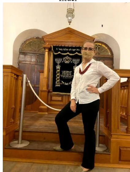
Figura 59 - Arca da Aliança - Sinagoga Karal Zur Israel