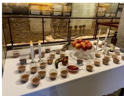
Figura 37 - Bolo de Mel