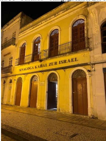
Figura 58 - Fachada - Sinagoga Karal Zur Israel