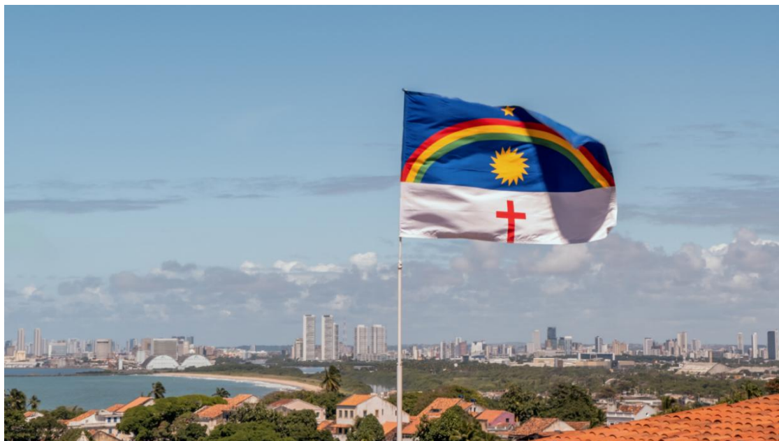
Figura 49 - Vista Aérea do Sítio Histórico de Olinda-PE

edifícios, jardins, as vinte (20) igrejas barrocas, conventos e inúmeras pequenas capelas que contribuem para o charme particular de Olinda.