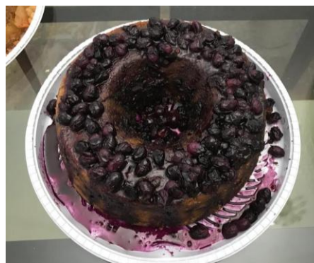
Figura 116 – Bolo de Uva

Bolo de Uva , a uva simboliza na cultura judaica votos de um ano doce e abundante, utilizada em diversas preparações e comemorações. É um elemento de fortalecimento e união entre os membros das comunidades.