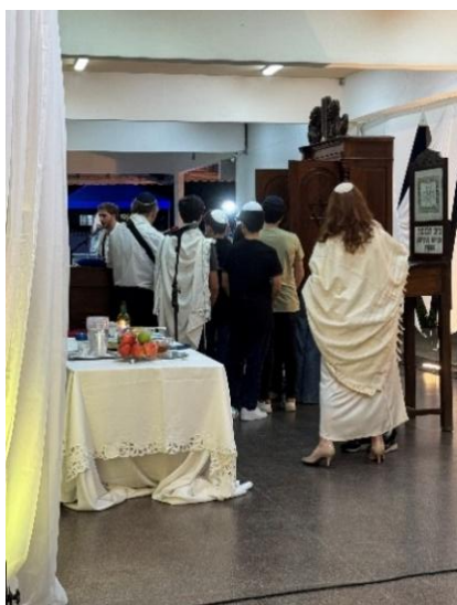
Figura 69 – Vestimentas na Rosh Hashaná

litúrgicos frequente escutados, orações recitativas - Amidá , centrais da liturgia judaica, lidas de pé.