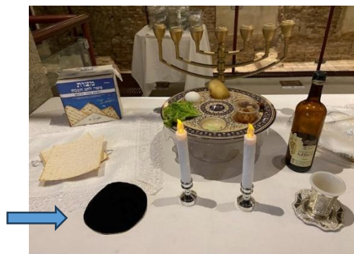
Figura 68 – Solidéu 7