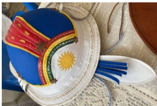
Figura 67 – Solidéu

Em se tratando de espaços glocal, de resistência, de luta por sobrevivência, pode-se descrever de um modo geral sobre as tradições judaicas em relação suas vestimentas, rituais de músicas e danças. Nos serviços religiosos, o judeu utiliza em suas vestimentas o xale de orações, designado de talit , equipado de tsitsit (franjas) um pequeno solidéu ( kipá ) para cobrir a cabeça e lembrar da presença de Deus. As mulheres, costumam cobrir a cabeça com lenço ou um chapéu. As cortinas do ambiente, de cor branca, já que tem um significado dentro da cultura judaica de pureza, “para mostrar que os judeus estão tentando limpar seus corações” (Algranti, 2002, p.85).