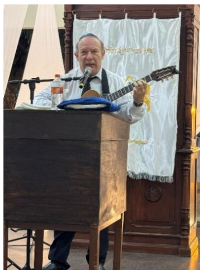
Figura 70 – Chazan na Rosh Hashaná