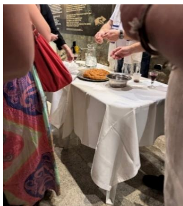
Fig. 128 – Ritual da Challah

No final do culto religioso, o ritual da partilha do challah , um pão judaico trançado ou arredondado, levemente adocicado, servido nas sinagogas ou nos lares judaicos todas as sextas-feiras, solidariamente, partilhada com as pessoas presentes numa atmosfera alegre, cordada e agregadora (Roque, 2016, p. 103), ou seja, o pão normalmente é rasgado com as mãos, salgado, e os pedaços são partilhados com as pessoas presentes nessa ocasião.