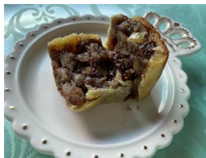
Figura 113 - Fluden

Fluden , doce fino, muito comum nas festas de um casamento e batizado, confeccionado com uma massa fininha, recheio pode variar de acordo com a região e/ou disponibilidade do damasco, goiabada, doce de jambo, castanhas, nozes e tâmaras.