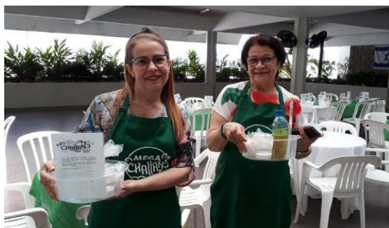
Figura 17 - Mega Challah 2019