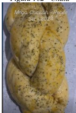
Figura 102 - Chalá