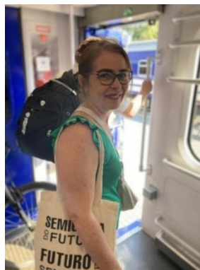
Figura 3 - Wejscie Dworzec de Chelm – Poland