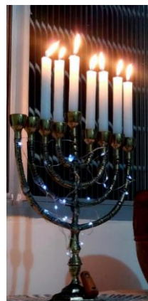
Fig. 133- Sétimo dia