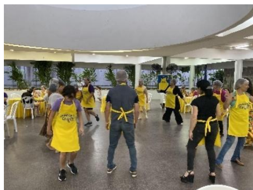
Figura 72 – Dança 8