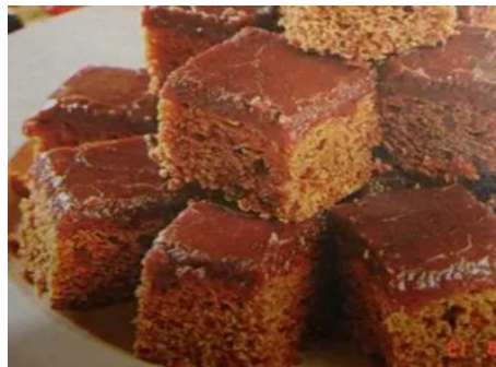
Figura 121 - Honik Lei Kech (Bolo de Mel)

Honik Lei Kech (Bolo de Mel) é uma preparação de tradição. Sobremesa sempre presente na mesa do Rosh Hashaná onde representa o desejo de um ano doce, cheio de boa sorte.