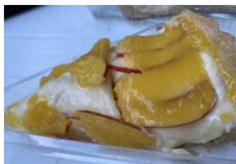
Figura 124 - Torta de Ricota com Maça

Torta de Ricota com Maça , uma massa leve com cheio de ricota, coberta com fatias de maçã e creme.