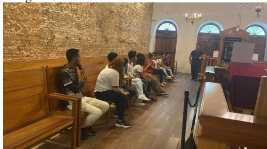
Figura 34 - Visita Técnica ETE Chico Science