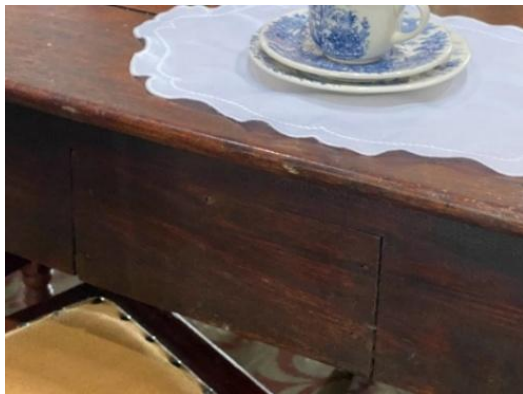
Fig. 139 – Mesa colonial com gaveta Engenho Baixa Verde – Pb.

comida em uma gaveta secreta da mesa da copa. Essa mesa foi encontrada no Engenho Baixa Verde na Paraíba.