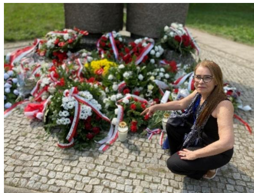
Figura 82 - Homenagem as vítimas do Holocausto