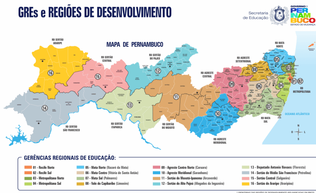
Figura 47 - Mapa de Pernambuco

Fonte: https://portal.educacao.pe.gov.br/gres-e-escolas/