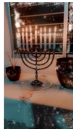
Fig. 134 – Nono dia