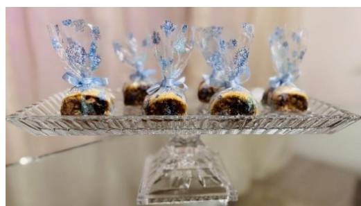
Figura 90 - Fludens