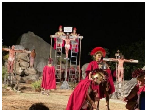
Figura 57 - Cena da crucificação de Jesus