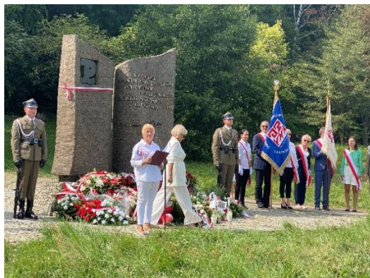
Figura 81 - Homenagem as vítimas do Holocausto