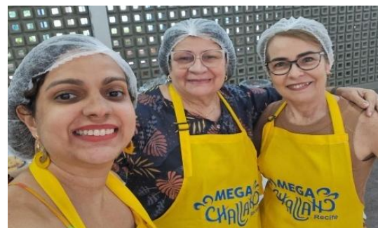
Figura – 18 - Mega Challah 2024