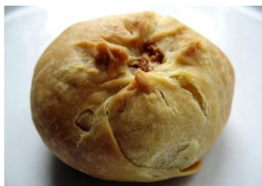
Figura 105 - Kenishers de Batata

O Kenishers de Batata é uma espécie de pastel, geralmente em forma retangular ou circular, recheado com uma variedade de ingredientes da culinária popular entre os judeus ashkenazi , provenientes da Europa Oriental – especialmente da Polônia, Rússia e Ucrânia.