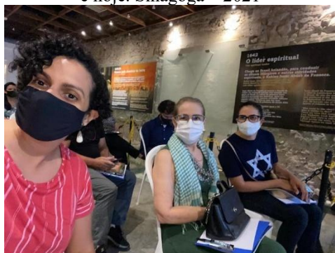
Figura 28 - Curso Cultura Judaica – Israel, ontem e hoje. Sinagoga – 2021

Outros eventos também fazem parte do calendário festivo e educativo do Museu Sinagoga Kahal Zur Israel e da Federação Israelita de Pernambuco – FIPE, que são promovidos como visitas, palestras e cursos.