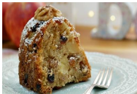
Figura 114 - Bolo de maçã e uva passa

Bolo de maçã e uva passa: produzido com maçã parve , não usa leite, respeitando as leis dietéticas judaicas.