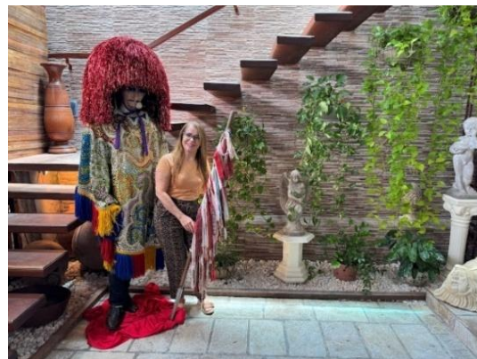
Figura 55 - Caboclo de Lança