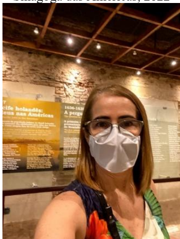
Figura 30 - Curso “Arqueologia da Primeira Sinagoga das Américas, 2022