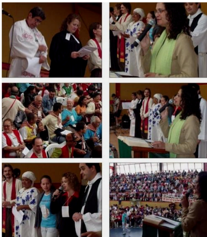
Foto 9 – Assembléias - Um ponto forte de discussão e conhecimento da realidade das CEBs